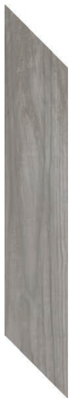
9.4 x 49 cm (4 x 20) SO.SD.GRY.0420.CHEV