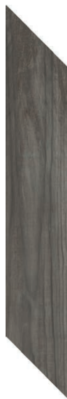
9.4 x 49 cm (4 x 20) SO.SD.DRK.0420.CHEV

Tous les items présentés dans ce document font partie du programme d'inventaire Olympia. Pour les commandes spéciales, veuillez contacter votre représentant de Tuiles Olympia.