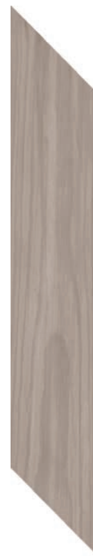
9.4 x 49 cm (4 x 20) SO.SD.TPE.0420.CHEV

Tous les items présentés dans ce document font partie du programme d'inventaire Olympia. Pour les commandes spéciales, veuillez contacter votre représentant de Tuiles Olympia.