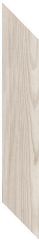
9.4 x 49 cm (4 x 20) SO.SD.SND.0420.CHEV