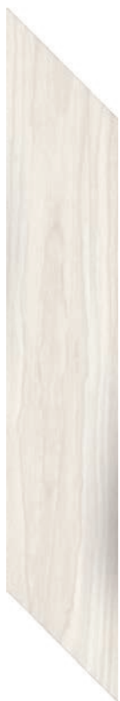
9.4 x 49 cm (4 x 20) SO.SD.LHT.0420.CHEV